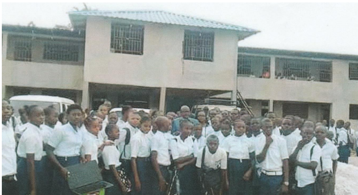
Trots poseren voor het nieuwe open leercentrum

In het Complexe Scolaire d'Excellence in Lodja krijgt het open leercentrum stilaan vorm! Hierin worden een openbare bibliotheek met leeszaal (de eerste in de provincie Sankuru!), een informaticalookaal, een vaklokaal wetenschappen en een naaiatelier ondergebracht. We schreven er reeds over in onze vorige nieuwsbrieven.